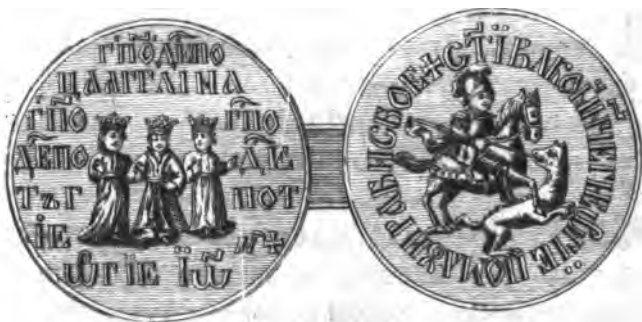
Hanc monetam auream quensam vidi diplomati uni à dictis Despotis Monasterio Sanctorum Petri et Pauli in Monte Athos existens dato Anno Mundi 7004 A.D. 1496.